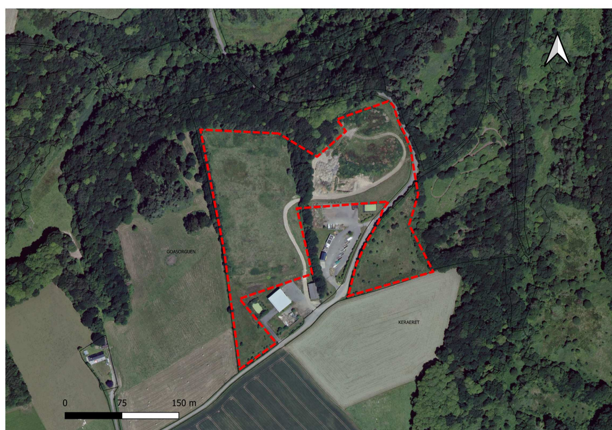
Emprise du projet