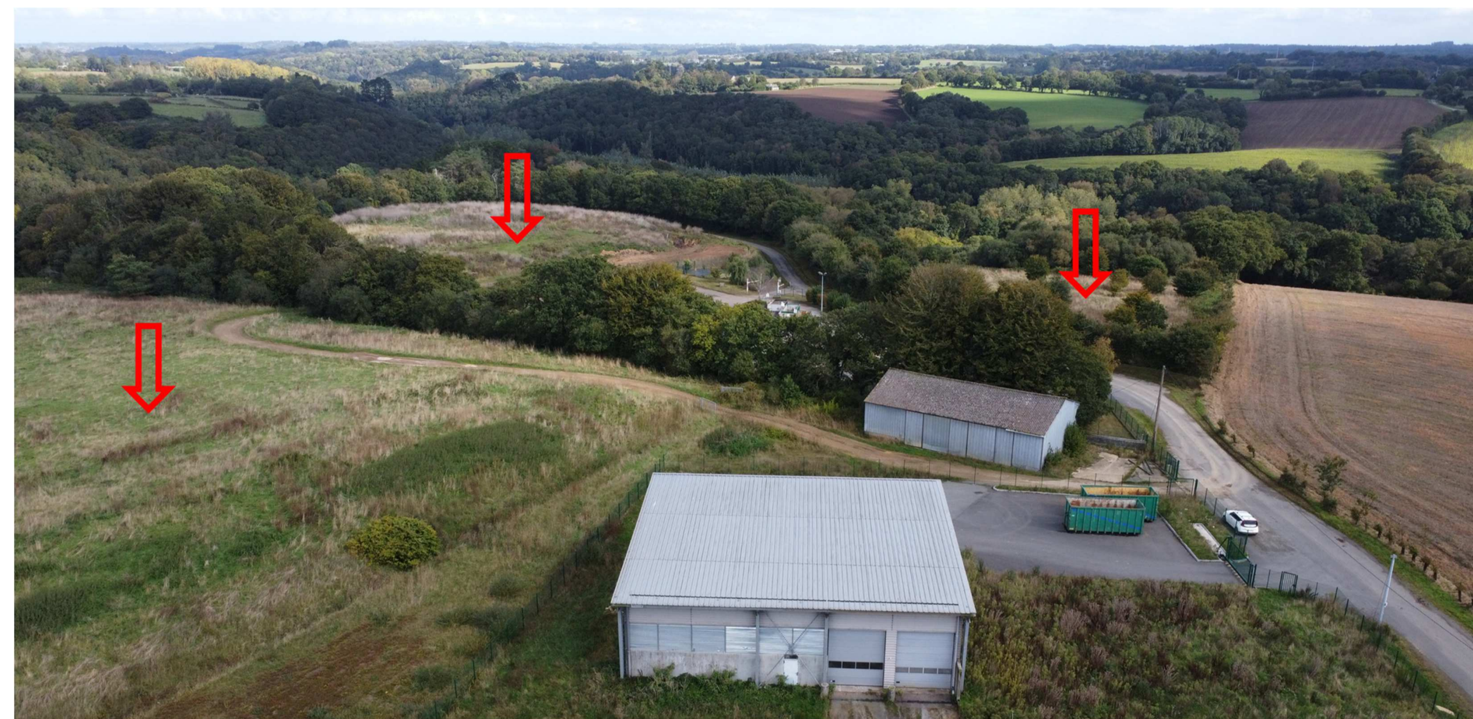
Vue du site du projet, situé près de la déchetterie de Goasorguen