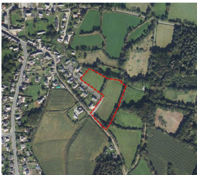
Figure 2 : Emplacement du projet de lotissement.

Une orientation d'aménagement et de programmation (OAP) sera créée afin de cadrer les aménagements et de préserver les éléments naturels présents sur site.