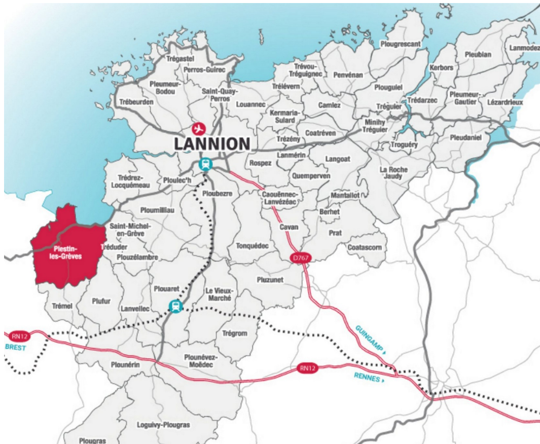
Figure 1 : Situation géographique de Plestin-les-Grèves.

La commune offre des paysages variés, allant des vallées boisées au littoral de la Lieue de Grève en passant par des plateaux agricoles. Le territoire communal comptabilise 296 km de haies et talus bocagers. Les espaces boisés classés représentent 488,3 ha, soit 14 % du territoire. De nombreux espaces naturels sont identifiés sur le territoire communal, tels que la zone Natura 2000 4 « la rivière le Douron » (directive habitats), des zones naturelles d'intérêt écologique, faunistique et floristique (ZNIEFF 5 ) de type I « falaises de l'Armorique », « le Grand Rocher », « basse vallée du Douron », plusieurs espaces naturels sensibles ainsi qu'un site classé.