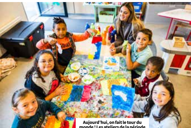
Aujourd'hui, on fait le tour du monde ! Les ateliers de la période d'automne sont consacrés à l'exploration des cinq continents.

accueil vient combler, là-aussi, des besoins sur cette partie du Trégor. En juillet et août, cet accueil de loisirs s'effectuera à Pleubian, en bord de mer. Orlane Boucher, responsable de l'accueil de loisirs sur ce secteur constate : « Les locaux sont bien adaptés aux 20 enfants que nous pouvons accueillir. L'école est accueillante ainsi que la cantine. Tout est clos, les enfants peuvent circuler facilement et librement. » ●