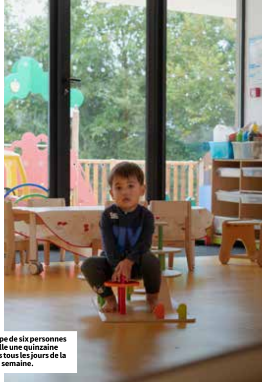
Une équipe de six personnes accueille une quinzaine d'enfants tous les jours de la semaine.

⊕ d'infos : accueil de 7h30 à 18h30, du lundi au vendredi. Infos auprès de l'animatrice du Relais Petite Enfance (RPE) : 07 86 00 89 29 - Maison Communautaire Kerantour à Pleudaniel.