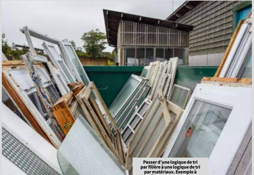
Passer d'une logique de tri par filière à une logique de tri par matériaux. Exemple à l'Objèterie de Lannion, avec le tri des huisseries.