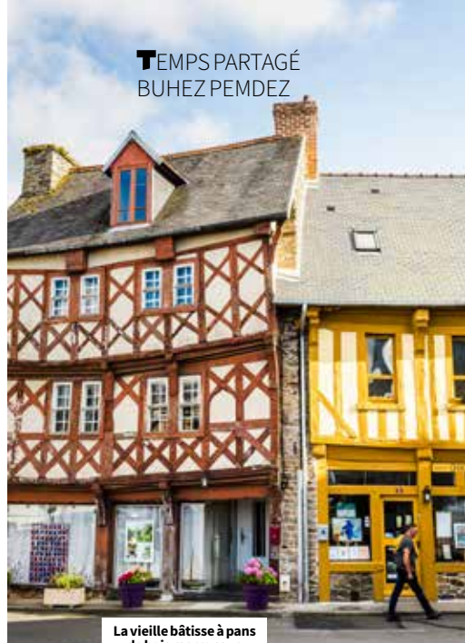
La vieille bâtisse à pans de bois marrons va bientôt retrouver son lustre d'antan.

Le propriétaire a bénéficié d'une aide de 8 145 € attribuée par LTC et une autre du même montant par la Ville. Le versement intervient à la fin des travaux. Au préalable du chantier, un diagnostic des pans a bénéficié de cette double subvention, à hauteur de 40 % du coût, soit deux fois 790 €. Par ailleurs, le label Petite Cité de Caractère, attribué à Tréguier, permet au propriétaire de bénéficier de 15 000 € de subvention complémentaire, et de 67 818 € par la Drac (Direction régionale des affaires culturelles), pour la façade et toiture inscrites au titre des monuments historiques. Guirec Arhant, vice-président à LTC, en charge du patrimoine et de l'habitat salue ce travail de rénovation exemplaire : « C'est une réalisation concrète de l'OPAH-RU lancée par Lannion-Trégor Communauté et la ville de Tréguier. Un pan de bois sauvé au pied de la cathédrale Saint-Tugdual. Un projet symbolique qui illustre le succès en cours d'opérations de ravalement de façades qui révèlent des pans de bois insoupçonnés. Et que dire du travail exceptionnel des entreprises qui sont intervenues ? Elles ont démontré qu'elles possédaient un savoir-faire incroyable. » ●