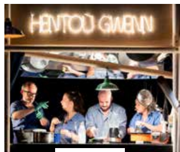
Nos voies lactées Teatr Piba